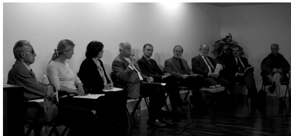
Angers - Décembre 2008